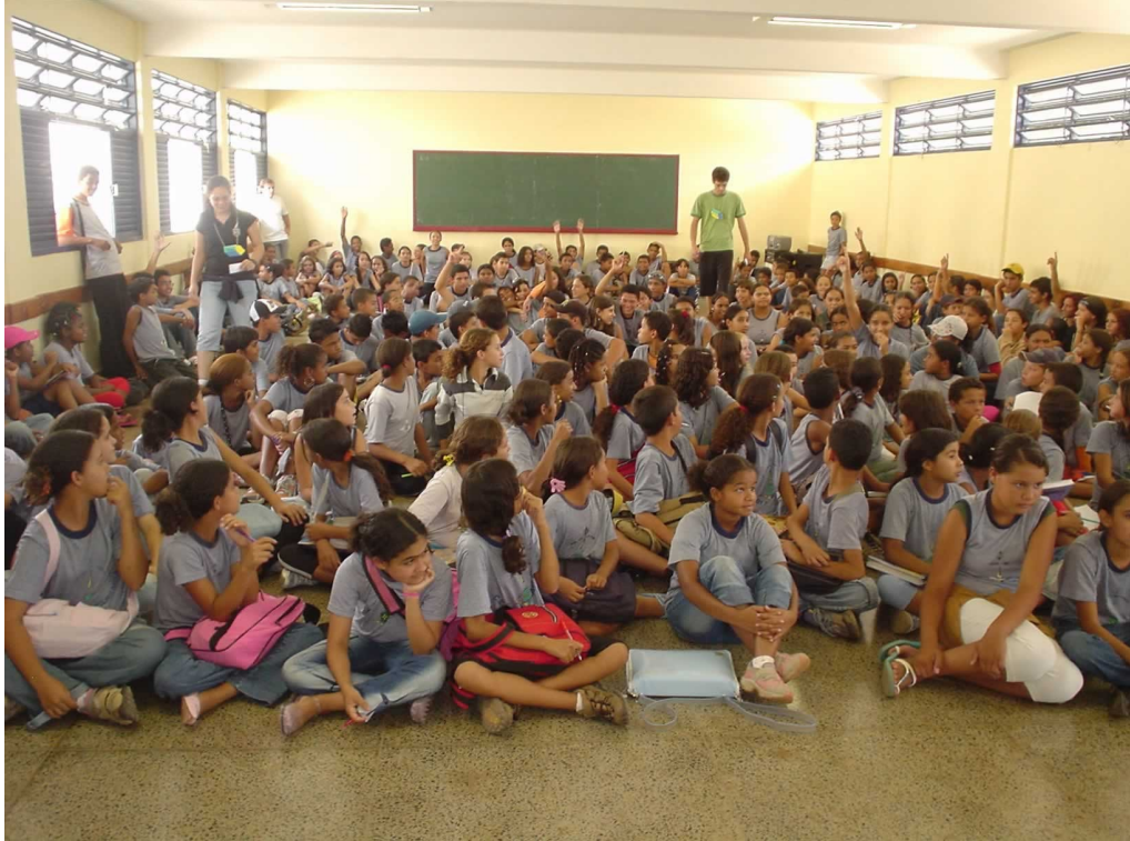
Vídeo apresentado aos alunos na disciplina de História ( FONTE DA LEGENDA TAMANHO 10 ).