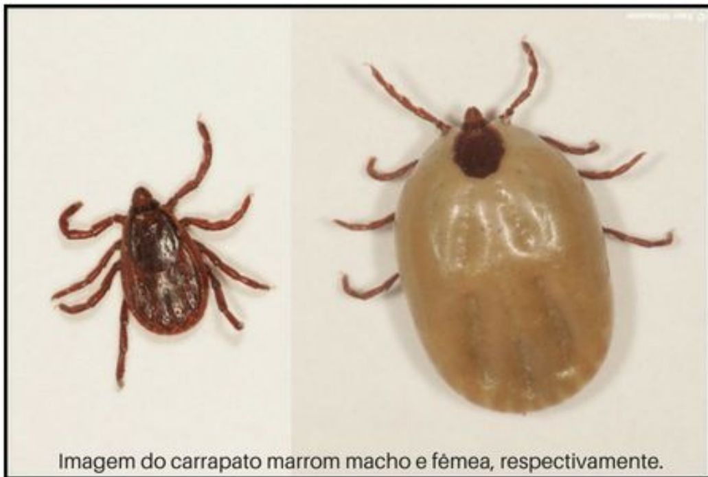
Imagem do carrapato marrom macho e fêmea, respectivamente.